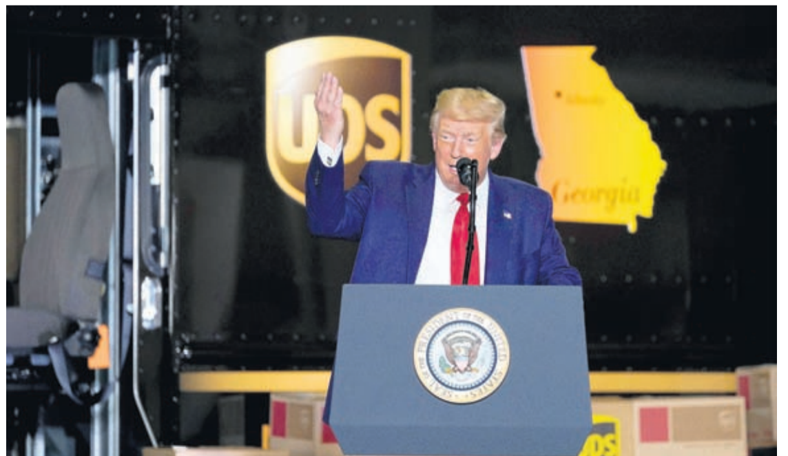
President Donald speaks during an event on American infrastructure at UPS Hapeville Airport Hub, Wednesday, July 15, 2020, in Atlanta.

“Together we're reclaiming America's proud heritage as a nation of builders and a nation that can get things done,” Trump said.